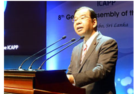
アジア政党国際会議（ICAPP）で発言する 日本共産党の志位和夫委員長＝2014 年

ASEAN（東南アジア諸国連合）の 国々がつくっている「東南アジア友好協 力条約」（TAC）のような、紛争を話 し合いで解決する平和の枠組みを北東ア ジアにつくりましょう！