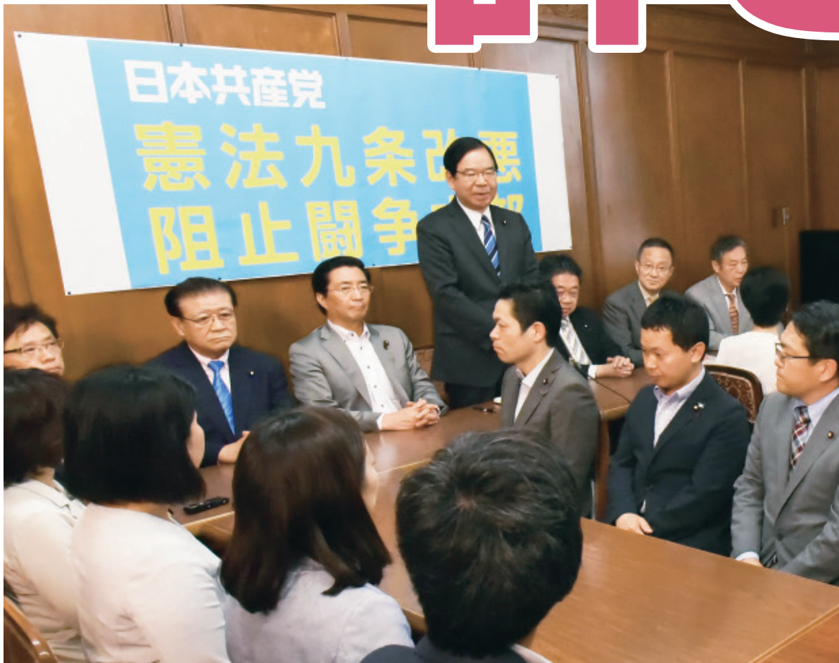
闘争本部であいさつする志位和夫委員長(中央)=5月16日、国会内