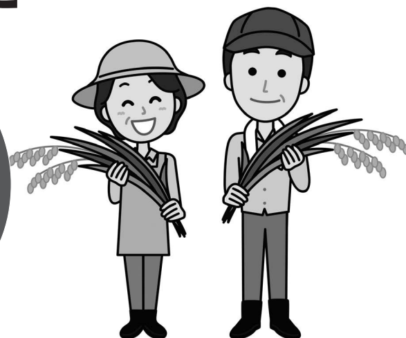
日本農業新聞農政モニター調査(7月28日付)より