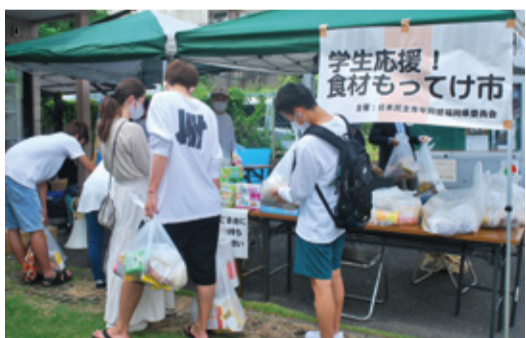
食材を受け取る学生たち=9月26日、福岡市城南区