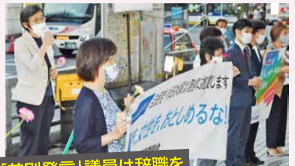
「差別発言」議員は辞職を

自民党・杉田水脈衆院議員の発言の撤回・謝罪・辞職を求める日本共産党の宣伝＝9月28日、東京・新宿駅西口