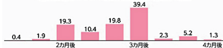
定額給付金(2009年)の給付開始時期別の自治体の割合

総務省資料から作成。補正予算成立(1月27日)から数えた給付開始時期別の自治体の割合。単位: %