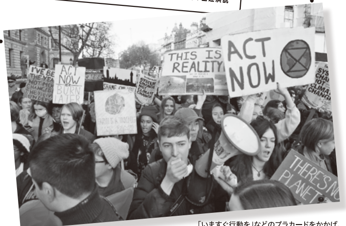
「いますぐ行動を」などのプラカードをかかげ、議会議場前でデモを行う学生たち=2019年11月29日、ロンドン