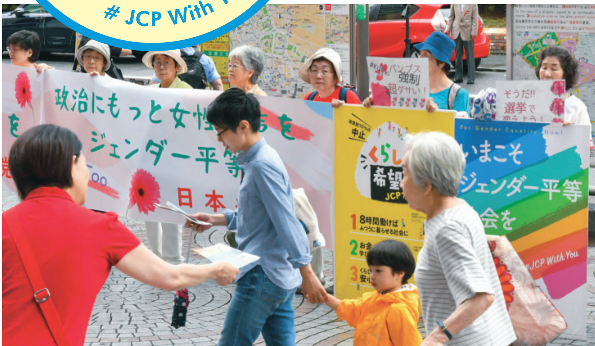
「ジェンダー平等を実現し、セクハラもパワハラもない社会にしよう」と訴える日本共産党全都女性後援会の街頭宣伝=6月22日、東京・新宿駅西口

世界でも日本でも、#MeTooはじめ性暴力やハラスメントに声を上げる人たちの輪が広がっています。