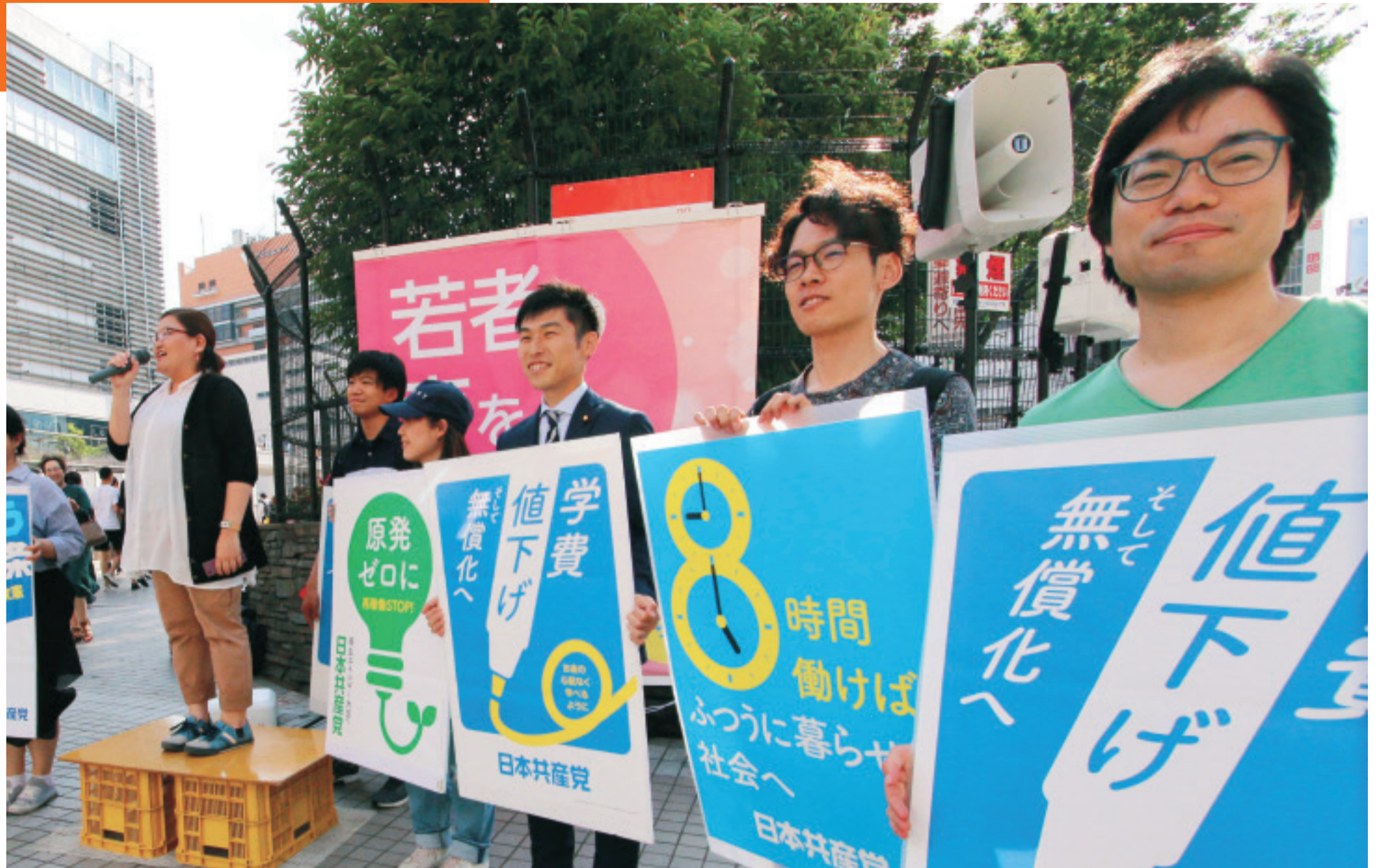
「若者が希望をもてる政治を」と訴える日本共産党と日本民主青年同盟の街頭宣伝。写真中央は山添拓参院議員=5月24日、東京・新宿駅東口