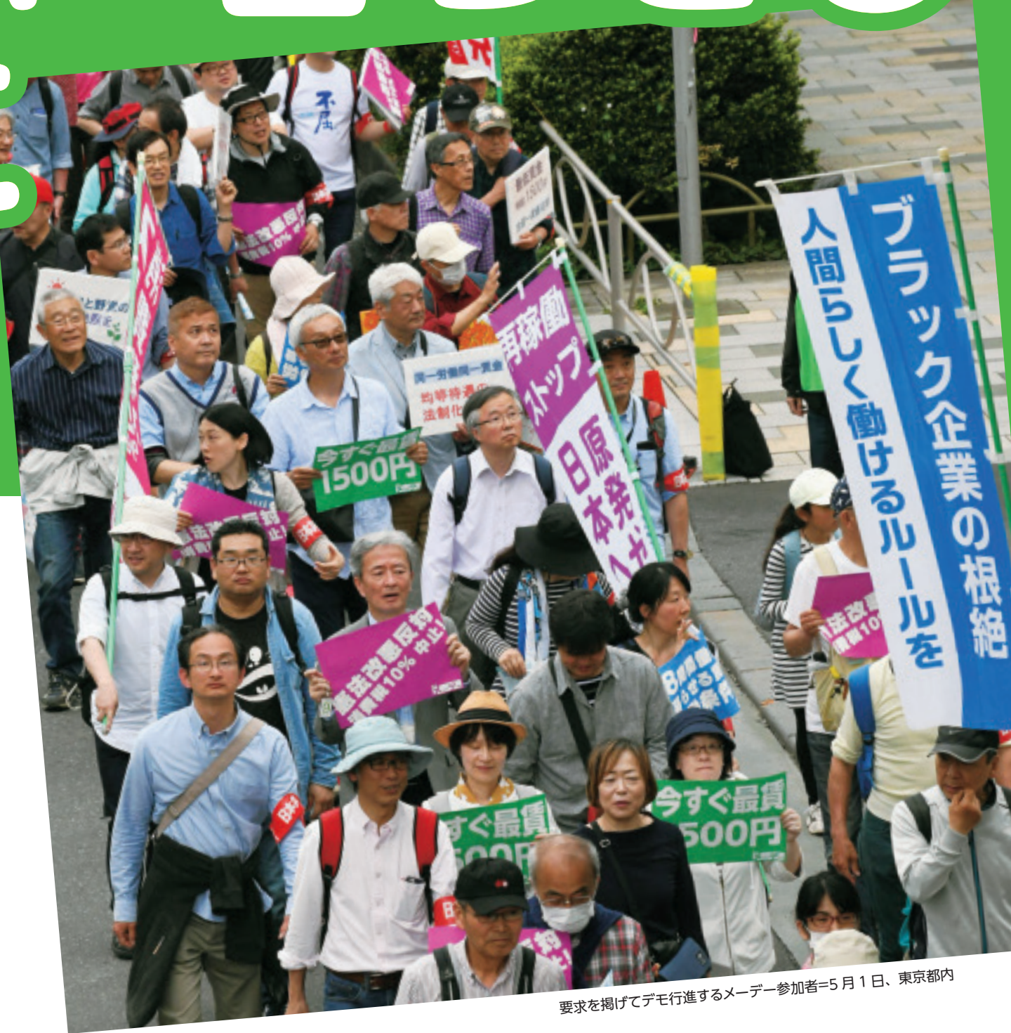
要求を掲げてデモ行進するメーデー参加者=5月1日、東京都内

賃金も個人消費も冷え切ったままで、国民に景気回復の実感はありません。いま求められているのは、家計を応援して格差と貧困をなくし、国民が明日への希望をもてる政治に転換することです。暮らしと経済を立て直すには、賃上げと安定した雇用の拡大が必要です。