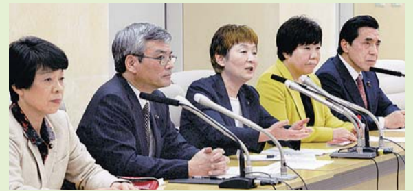
●都議会改革を提案し、他党派によびかける共産党都議団