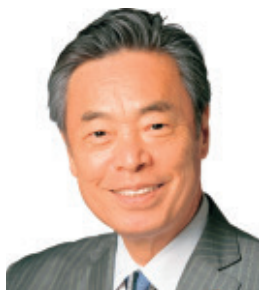
近畿ブロック 穀田 恵二