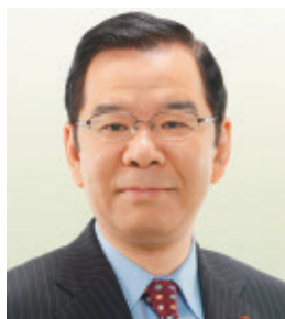
南関東ブロック 志位 和夫