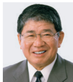
沖縄1区 赤嶺 政賢