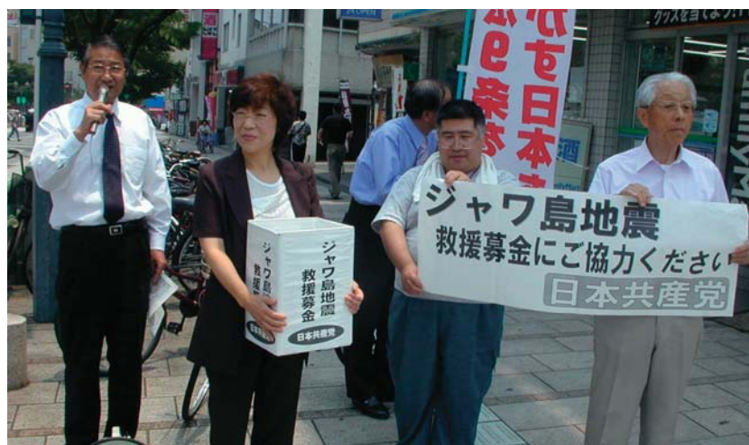
ジャワ島地震救援募金をよびかける大分北部地区委員会の人たち＝2006年6月3日、大分・別府市