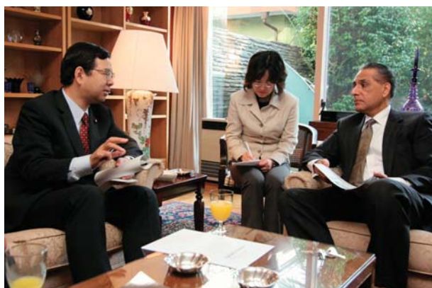
カムラン・ニアズ駐日パキスタン大使(右)に被災者義援金を届けた志位和夫委員長＝2005年11月1日、東京・港区