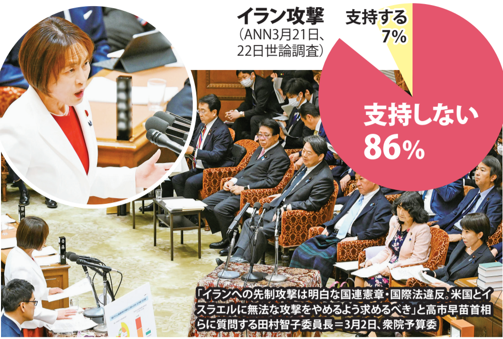
イラン攻撃 (ANN3月21日、22日世論調査)