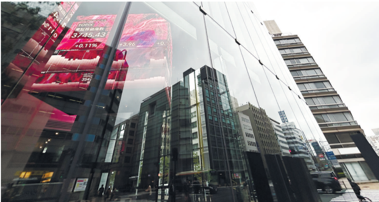
株価指数を表示したオフィスビル内の電光掲示板＝東京都中央区兜町