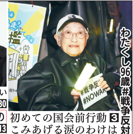
初めての国会前行動 3 こみあげる涙のわけは