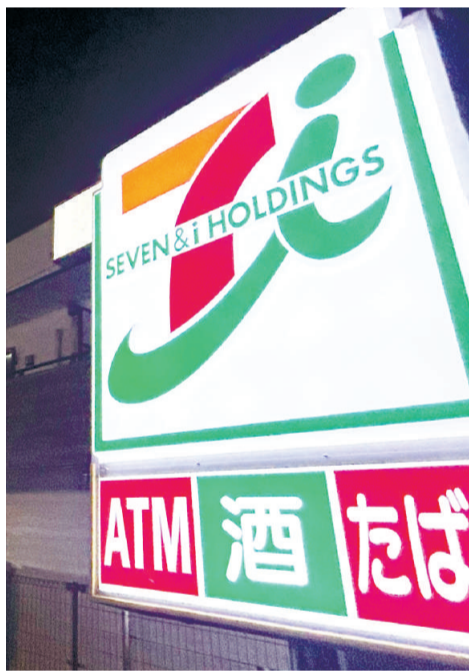
セブンイレブンの店舗