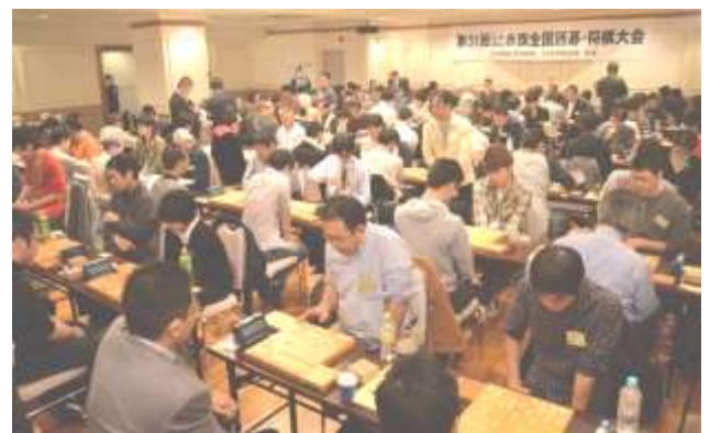
熱戦をくりひろげる参加者のみなさん