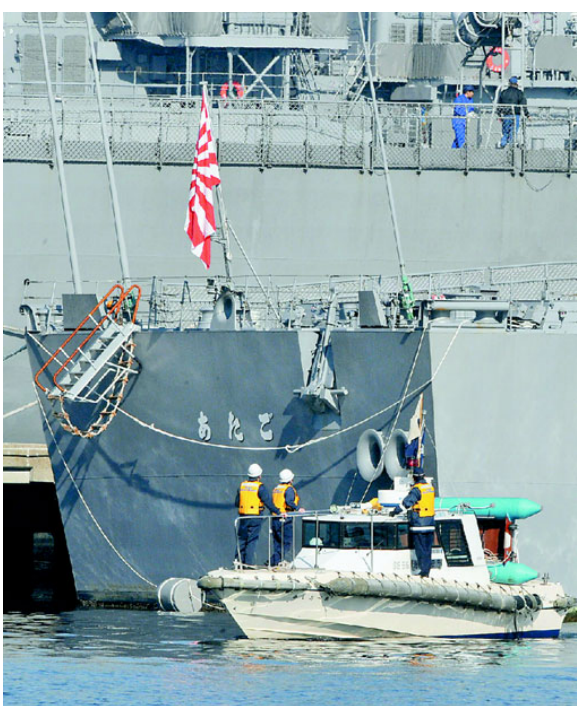
漁船と衝突したイージス艦「あたご」の船体を調べる海上保安庁の保安官ら＝2月20日午前9時半ごろ、神奈川県横須賀市の海上自衛隊横須賀基地