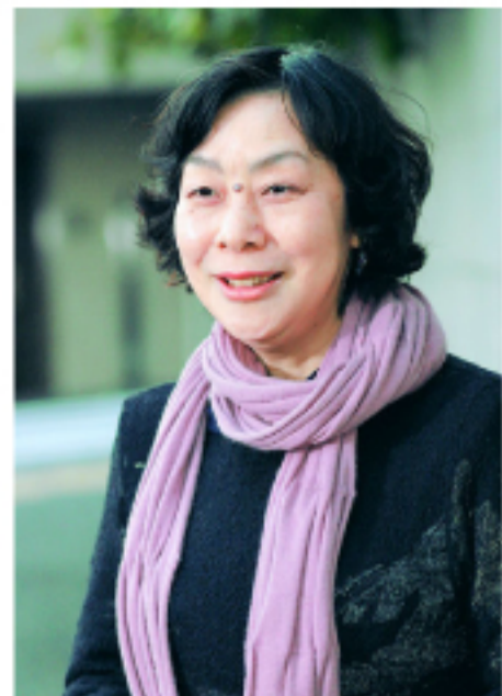
はぎむらもと 1949年福岡県大牟田市生まれ。20歳のとき、「ルルとミミ」でデビュー。主な作品は『トーマの心臓』、『トーマの心臓』、『11人いる!』(この二作で小学館児童文芸賞)、『百鬼の夜と千鶴の涙』、『メッシーノ』、『マーチンガール』、『精緻な神が支配する』(平塚由田文化賞受賞)ほか。