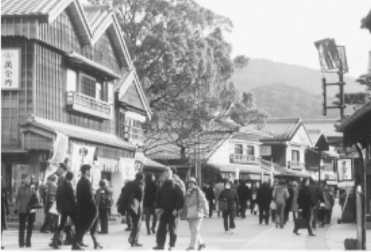
おはらい町の妻入り民家。横と直角の妻の割合 出入口口としている。観光客でにぎわう街中