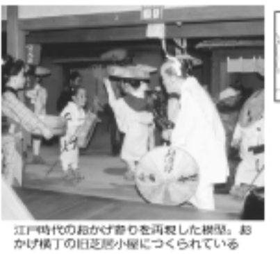
江戸時代の船かけ番りを再現した施設。船 かけ横丁の旧芝居小屋につくられている