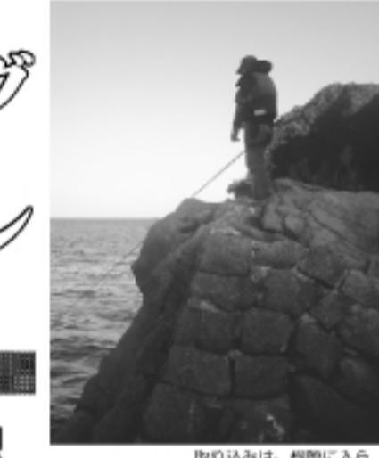
取り込みは、根際に入ら れないイサキはききが必要