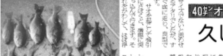
ひさびさの大釣り