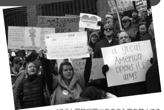
イスラム圏特定国出身者の入国を禁止する大統領令に抗議する市民=1月29日、ワシントン

トランプ政権が今後、「米国第一」の立場から日本に圧力をかけてくることも考えられる。追従外交でいいのか、問われている。