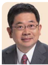
比例代表 小池 晃