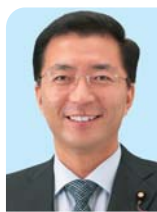
比例代表 山下 芳生