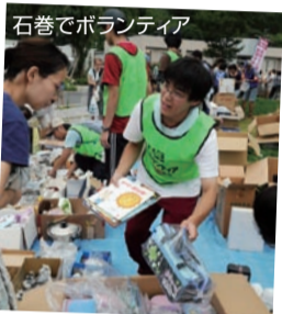
石巻でボランティア

党員31万人、2万の党支部、 2700人の地方議員が草の根で 国民とともに。政党助成金を受 けとらず、税金のムダたらず。