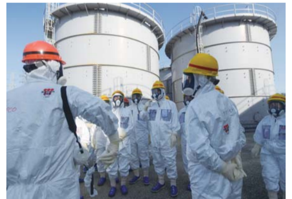
「まだ事故の真っ只中」—福島第一原発を視察した志位委員長ら日本共産党代表团、3月9日