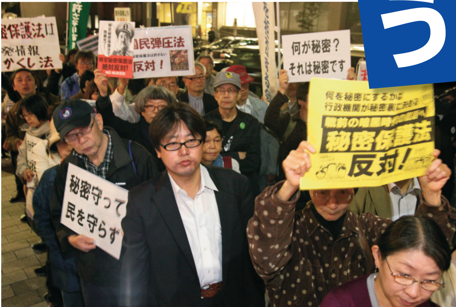
「秘密保護法はいらない」と訴える「秘密保護法NO! 首相官邸前行動」の参加者=10月22日