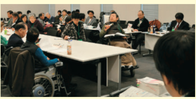
厚生労働省と交渉する障全協のみなさん=国会内