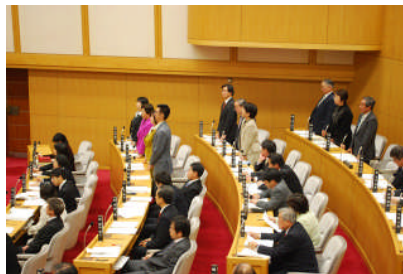
請願採択に「賛成」の起立する共産党議員(奥)と、「反対」(起立しない)する他党議員(手前)

昨年末に、この計画の中止をもとめる請願が、市議会にだされました。日本共産党は、「賛成」しましたが、市民も、民主も、公明も、ネットも、無所属も、みんな「反対」の態度で、「不採択」になってしまいました。