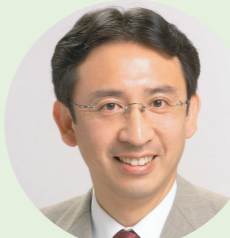
塩川鉄也 衆議院議員