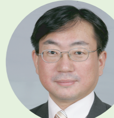
酒井宏明 党国会議員団 群馬事務所長