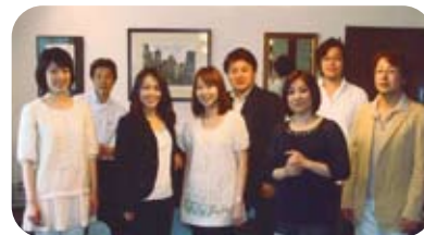
二期会マイスタージンガー

二期会の豊富な人材のなかからピックアップされたメンバーで構成するアンサンブルグループ。