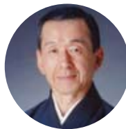
原田直之(民謡歌手)