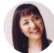
普天間かおり(歌手)

日本を代表するジャズ・ヴァイオリニスト。繊細な表現力と情熱的な演奏で聴衆を魅了。