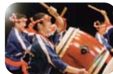
荒馬座(民族歌舞団)

二期会の豊富な人材のなかからピックアップされたメンバーで構成するアンサンブルグループ。