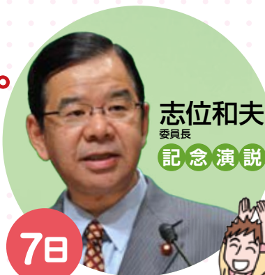
志位和夫 委員長 記念演説