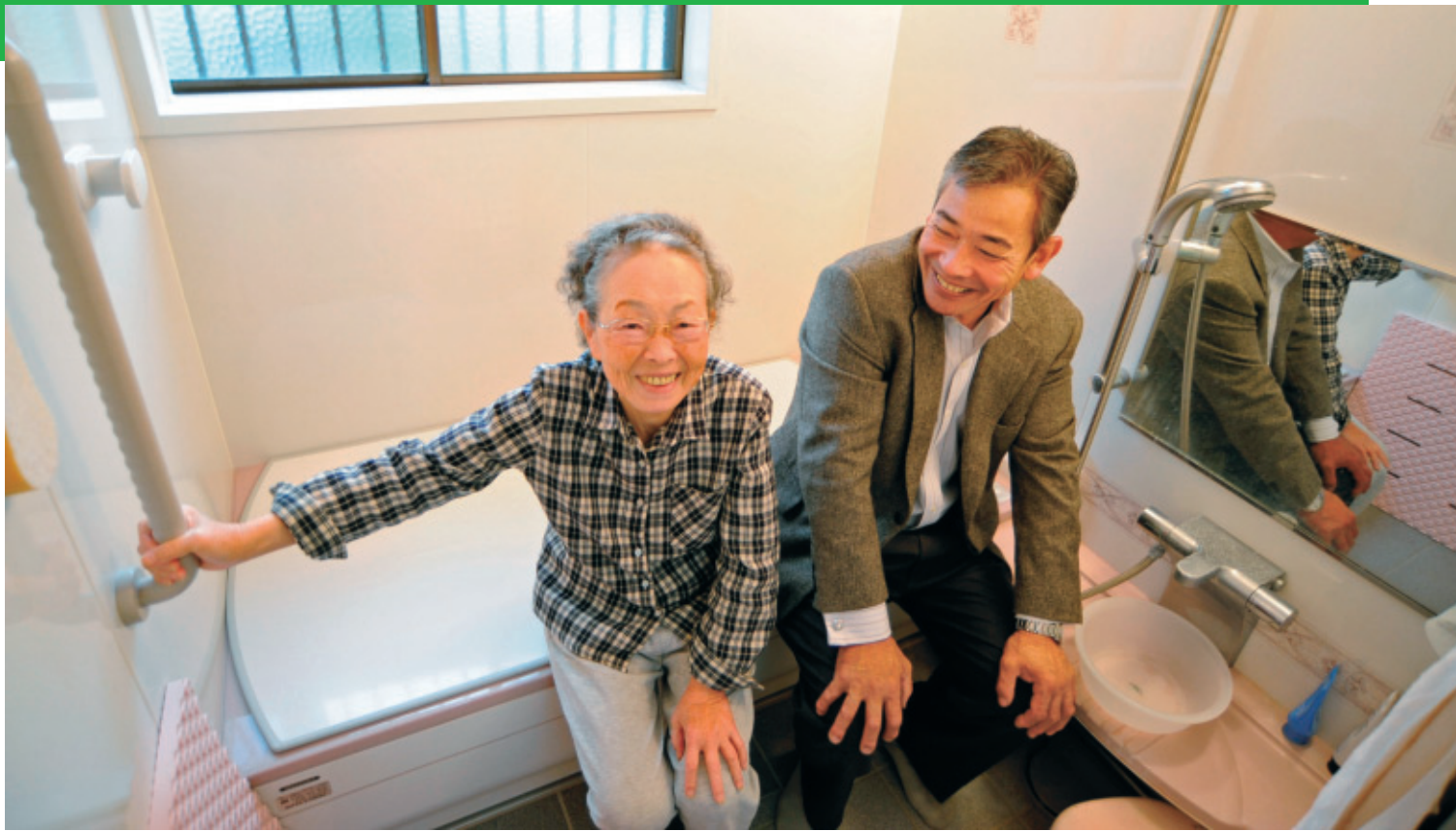
制度を利用して風呂場の改修と同時に昇降食器棚を設置しよるこぶ施主と施工業者=兵庫県・明石市