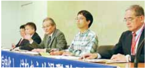
会見するJMIU組合員らー27日、厚生労働省

電話: 03(3403)6111 ファクス: 中央委員会03(5474)8358 赤旗編集部03(3350)1904 http://www.jcp.or.jp/